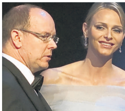
Verliebt, verlobt, bald verheiratet: Fürst Albert II. und Charlene Wittstock.

Sechs Wochen bis zur Hochzeit von Monacos Fürst Albert II. mit Charlene Wittstock. Das Paar wünscht sich Nachwuchs